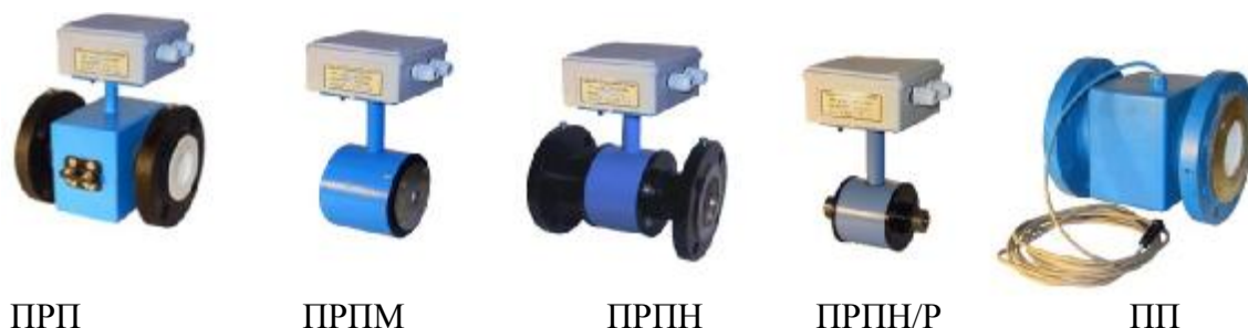
Рисунок 1. Внешний вид ППР

Типы и внешний вид ППР и ИВБ приведены на рисунках 1 и 2.