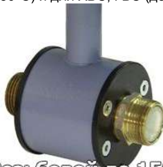
Резьбовой до 150°C

Если же вам нужны расходомеры с минимальным весом и ценой рекомендуем использовать резьбовой вариант (р). Здесь вообще нет фланцев, это идеальный вариант для подключения к неметаллическим трубопроводам. Резьбовые расходомеры по температурному режиму подразделяются на две категории: стандартные (держат до 150°C) и для ХВС, ГВС (держат до 90°C).