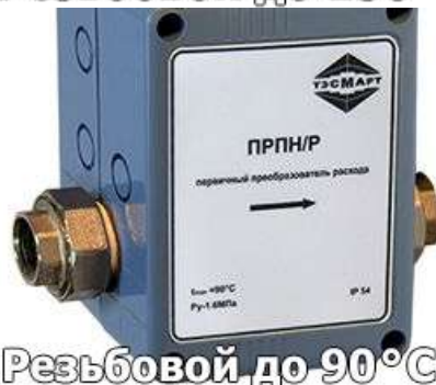
Резьбовой до 90°C